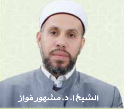
الشيخ ا.د. مشهور فوزان

بإمكانكم أن ترسلوا أسئلتكم على الموقع الخاص بالدكتور مشهور فوزان رئيس المجلس الإسلامي للإفتاء www.dr-mashhour.com