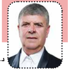
د. سمير صبحي - رئيس بلدية أم الفحم

تتكامل مباشرة مع المبادرات المجتمعية الميدانية لـ «منتدى الناشطين البيئيين» و«خريجات دورات القيادة النسائية البيئية الفحماوية». يساهم هذا التعاون بين البلدية والجمهور في إنجاح مشاريع نوعية مثل مبادرة «نحل المدينة»، واستبدال 100% من إنارة الشوارع بنظام LED ذكي، وتغيير أكثر من 85% من الإضاءة في المؤسسات التعليمية، وتوجيه العوائد المالية مباشرة إلى «صندوق الطاقة البلدي» المخصص لتعزيز العدالة التوزيعية ومعالجة فقر الطاقة في الأحياء القديمة.