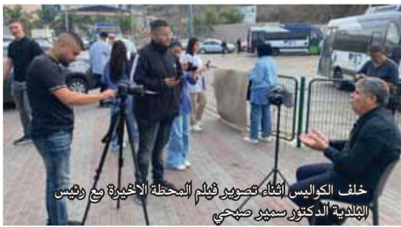
خلف الكواليس أثناء تصوير فيلم المحطة الأخيرة مع رئيس البلدية الدكتور سمير صيحي