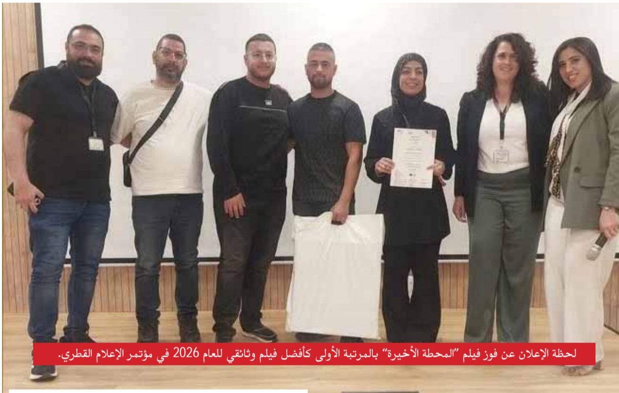
لحظة الإعلان عن فوز فيلم "المحطة الأخيرة" بالمرتبة الأولى كأفضل فيلم وثائقي للعام 2026 في مؤتمر الإعلام القطري.

فرع الإعلام يحصد المرتبة الأولى قطرياً عن فيلم "المحطة الأخيرة" كأفضل فيلم وثائقي للعام 2026